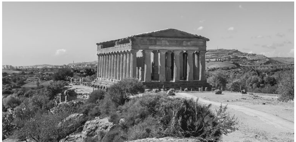
Valle dei Templi, Agrigento.